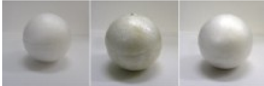
Superficie brillante, superficie satinada, superficie mate.

Igual Fuente de Luz – variable en la superficie del objeto ( Cesía )