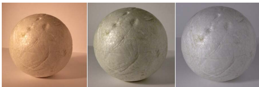
Luz cálida, luz natural, luz fría.

Distintas calidades de Fuentes de Luz: Luz cálida – Luz natural – Luz fría