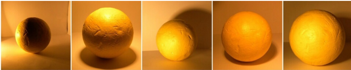
Luz Lateral desde abajo – Luz Cenital - Luz Lateral - Luz Frontal Lateral - Luz Frontal